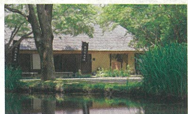
⑦備前長船刀剣博物館

地産地消、安全安心で「健康な食」をテーマに、豊かな自然と温暖な気候で美味しく育った岡山や瀬戸内の食材を中心に使用し、提供しています。