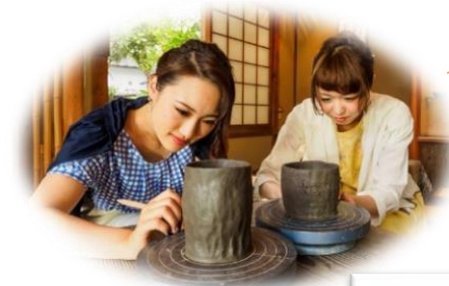
土ひねり体験 (※要予約)

【旧閑谷学校 史跡入場料】 大人 400 円 小中学生 100 円 65 歳以上 200 円 (※障害者手帳提示の方は無料) 団体割引 (30 人以上) 大人 320 円 小中学生 80 円 【 TEL:0869-67-1436 】