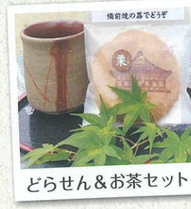
どろせん＆お茶セット