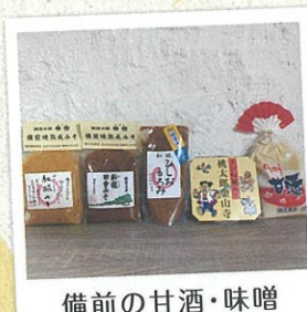
備前の甘酒・味噌