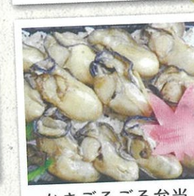
かきごろごろ弁当