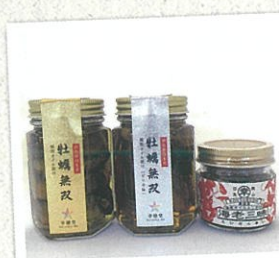
牡蠣無双と海老三昧