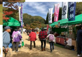
テント村 出店一例