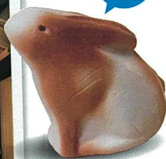
天津神社 欄宣 日幡 博行 作