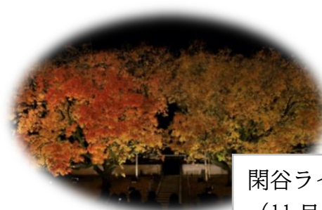
閑谷ライトアップ (11月頃)