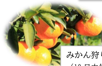
みかん狩り (10月中旬～12月初旬)