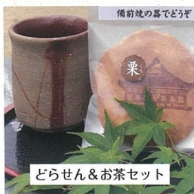
どらせん&お茶セット