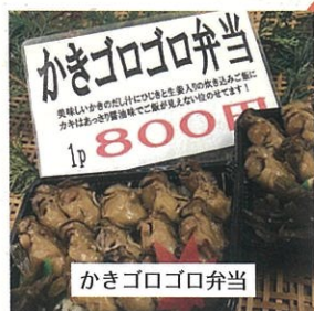
かきゴロゴロ弁当